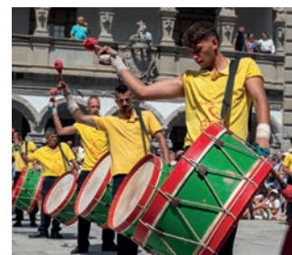
Bombos de Viana / Viana Drums