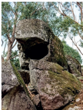
Monumento do Penedo Furado / Penedo Furado Monument