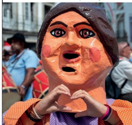
Cabeçudos de Viana / Viana Cabeçudos "bigheads"

The Viana do Castelo Aspiring Geopark covers the entire area of the municipality, about 320 km 2 which host the northernmost Atlantic city of Portugal - Viana do Castelo. A destination of excellence sustained by its geographical characteristics of high environmental, landscape, cultural and touristic value, where the natural and cultural, material and immaterial heritage is inextricably linked, creating a perfect harmony.