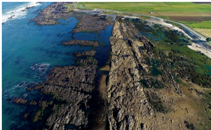
Monumento das Pedras Ruivas / Pedras Ruivas Monument