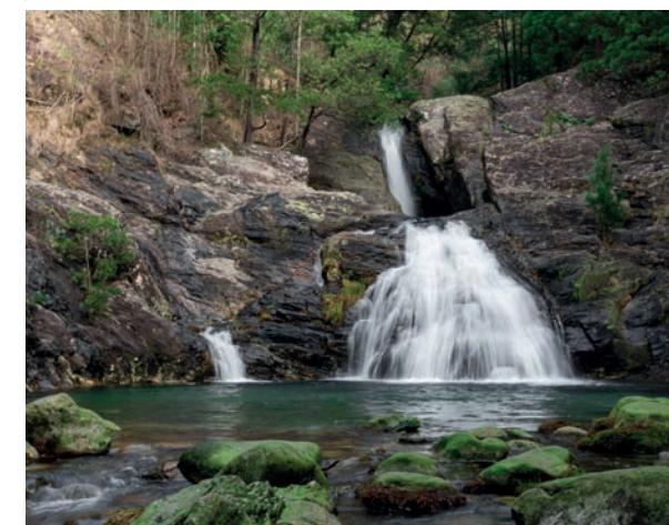
Monumento das Cascatas da Ferida Mã / Ferida Mã Cascades Monument

A place to travel through places of outstanding and unique natural value for their beauty, but also for their important testimony to geological processes that illustrate the history of life on Earth and the remarkable richness of its biodiversity.