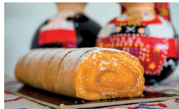
Torta de Viana / Viana cake