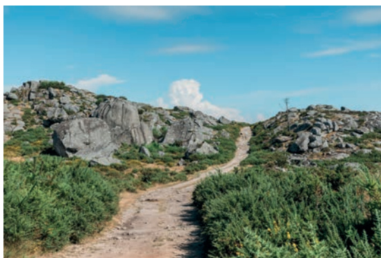
PR1 | Trilho da Montanha Sagrada / PR1 | Sacred Mountain Trail

Por entre o mar, o rio e a montanha, conheça a natureza no seu estado mais puro, percorrendo os percursos pedestres assinalados, que compõem a Rede Municipal de Trilhos de Viana do Castelo. Estão ainda disponíveis percursos equestres identificados, para quem preferir dar um passeio a cavalo para vislumbrar as belas paisagens naturais Vianenses.