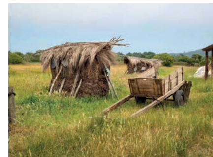
Palheiros de sargasso / Sargasso haystacks