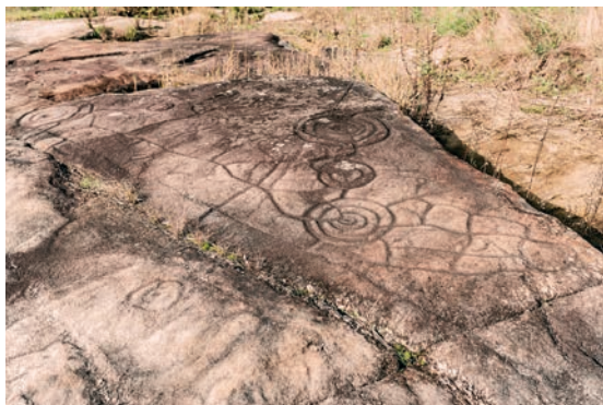
Gravuras Rupestres / Rock engravings

Dos achados arqueológicos, que conferem a presença humana desde tempos imemoriais, aos testemunhos edificadas de épocas antigas e recentes, dos modos peculiares de celebrar as festividades (como a Romaria em Honra da Senhora da Agonia), não esquecendo as tentadoras iguarias gastronómicas, fazem de Viana do Castelo um ícone emblemático de profunda riqueza histórica, que se impõe conhecer intimamente.