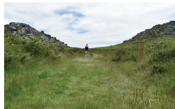
PR2 | Trilho dos Pastores / PR2 | The Shepards Trail

Between the sea, the river and the mountain, get to know nature at its purest state by walking the marked footpaths that make up the Municipal Trails Network of Viana do Castelo. There are also identified equestrian trails available, for those who prefer horse riding to enjoy the beautiful natural landscapes of Viana do Castelo.