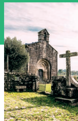
Capela Românica de São Cláudio / Romanesque Chapel of Saint Cláudio