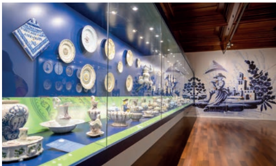
Museu de artes decorativas / Museum of decorative arts