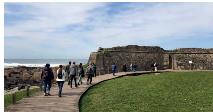
Ecovia Litoral Norte / North Coast Ecoway

Between the sea, the river and the mountain, get to know nature at its purest state by walking the marked footpaths that make up the Municipal Trails Network of Viana do Castelo. There are also identified equestrian trails available, for those who prefer horse riding to enjoy the beautiful natural landscapes of Viana do Castelo.