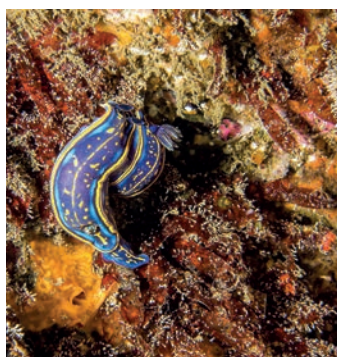
Nudibrânquios / Nudibranchs

Sítio para viajar por lugares de valor natural notável e singular pela sua beleza, mas, também, pelo seu importante testemunho de processos geológicos ilustrativos da história da vida na Terra e pela riqueza assinalável da biodiversidade.