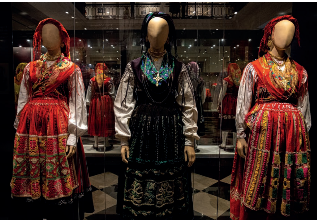
Traje à Vianesa / Vianesa Costume

Ao percorrer o território de Viana do Castelo podem-se fazer passeios de bicicleta, a pé ou a cavalo por um dos vários trilhos pedestres/equestres assinalados. As várias praias de areia fina e dourada convidam a banhos de sol e de mar, mas também à prática de desportos aquáticos. Viana do Castelo é cor, é amor, é vida no seu esplendor!