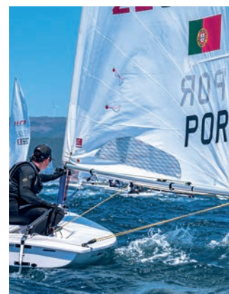
Competição de vela / Sailing competition

The intense human presence in the territory of Viana do Castelo results in various archaeological finds, the emblazoned houses, churches and convents, and the fountains and traditional standpipes. There is still a legacy of traditions and rituals, with special emphasis on the beauty and exuberance of the typical garments, decorated with filigree, which is paraded in the largest pilgrimage in the country, in honour of Senhora da Agonia. When travelling through the territory of Viana do Castelo, you can go cycling, walking or horse riding through one of the many pedestrian/equestrian trails marked. The various beaches of fine golden sand invite you to sunbathe and swim, but also to the practice of water sports.