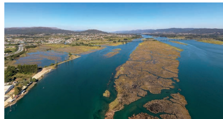
Monumento das Ínsuas do Lima / Insuas of Lima Monument

These are 13 emblematic places due to the uniqueness of their natural values, especially the geological heritage, and also due to their cultural richness and breathtaking landscapes.