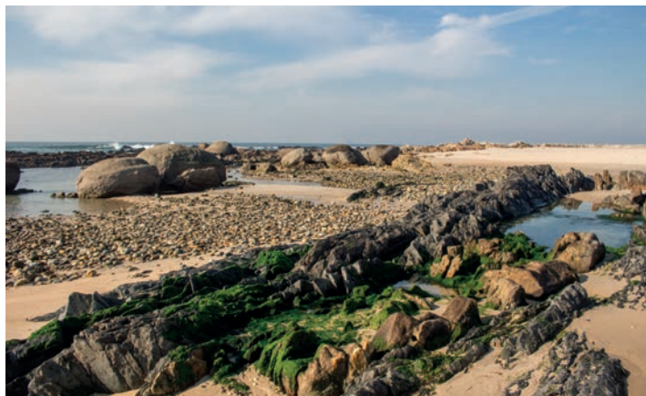
Monumento do Canto Marinho / Canto Marinho Monument