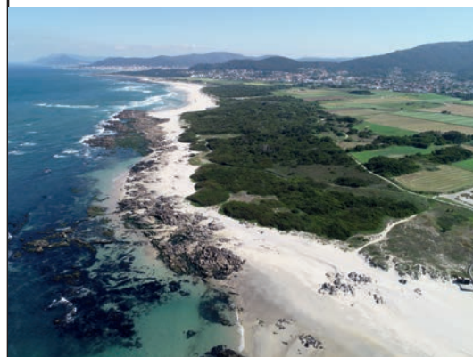
Praia do Paçô / Paçô Beach