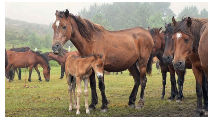
Cavalo Garrano | Sítio da Serra d'Arga / Garrano horse | Serra d'Arga Site