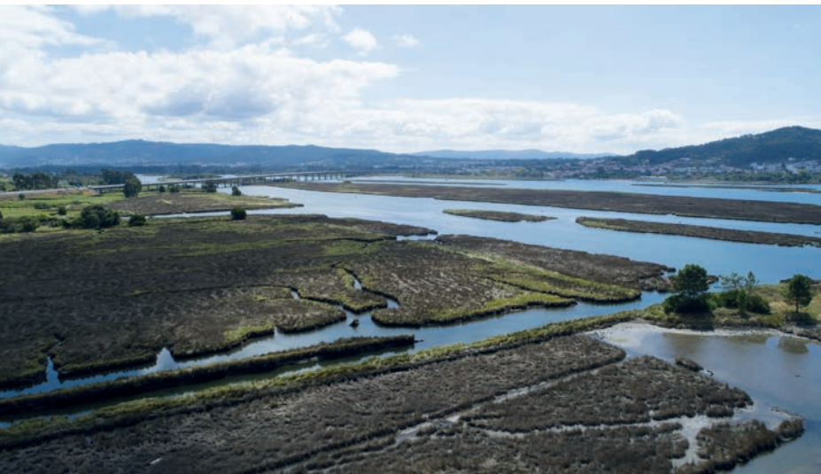
Zonas húmidas | Sítio do Rio Lima / Wetlands | Lima River Site

Inseridos na Rede Natura 2000, Viana do Castelo possui 3 locais que se destacam pelo seu elevado índice de biodiversidade, como o Sítio Litoral Norte que corresponde a espaços litorais (sistemas dunares e rochedos litorais), o Sítio Rio Lima a espaços estuarinos e ribeirinhos e o Sítio Serra de Arga a espaços montanhosos e ribeirinhos. São áreas de paisagens excepcionais, a serem exploradas para conhecimento e admiração da riqueza da fauna e flora local.