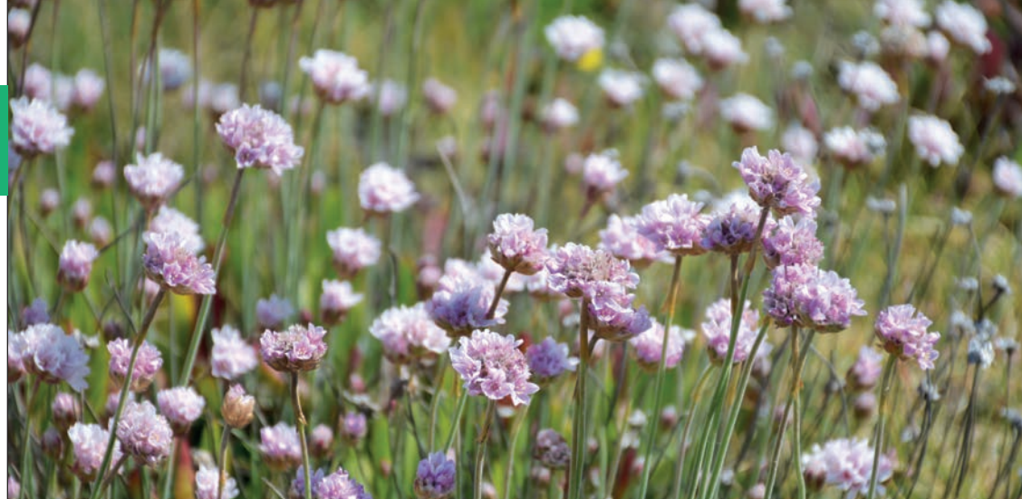
Armeria pubigera | Sítio do Litoral Norte / Armeria pubigera | North Coast Site

Part of the Natura 2000 Network, Viana do Castelo has 3 sites that stand out for their high levels of biodiversity, such as the Litoral Norte site, which corresponds to coastal spaces (dune systems and coastal cliffs), the Rio Lima site for estuarine and riverine spaces and the Serra de Arga site for mountainous and riverine spaces. These are areas of exceptional landscapes, to be explored for knowledge and admiration of the richness of the local fauna and flora.