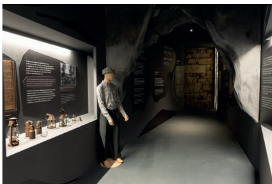
Porta de Arga / Arga Gateway

O Aspirante Geoparque Viana do Castelo integra uma Rede de Portas - Porta do Neiva | Do Mel e do Caulino, a Porta de Arga | Os Mineiros e os Minérios e a Porta do Atlântico | Observatório Litoral Norte - que constituem pontos de entrada no território para a promoção e divulgação do património local.