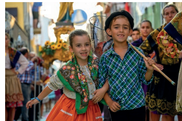
Romaria de Nossa Senhora d'Agonia / Pilgrimage of Our Lady of Agony

From the archaeological findings, which prove the human presence since immemorial times, to the built testimonies from ancient and recent times, from the peculiar ways of celebrating festivities (such as the Pilgrimage in Honour of Senhora da Agonia), not forgetting the tempting gastronomic delicacies, make Viana do Castelo an emblematic icon of deep historical richness, which is necessary to know intimately.