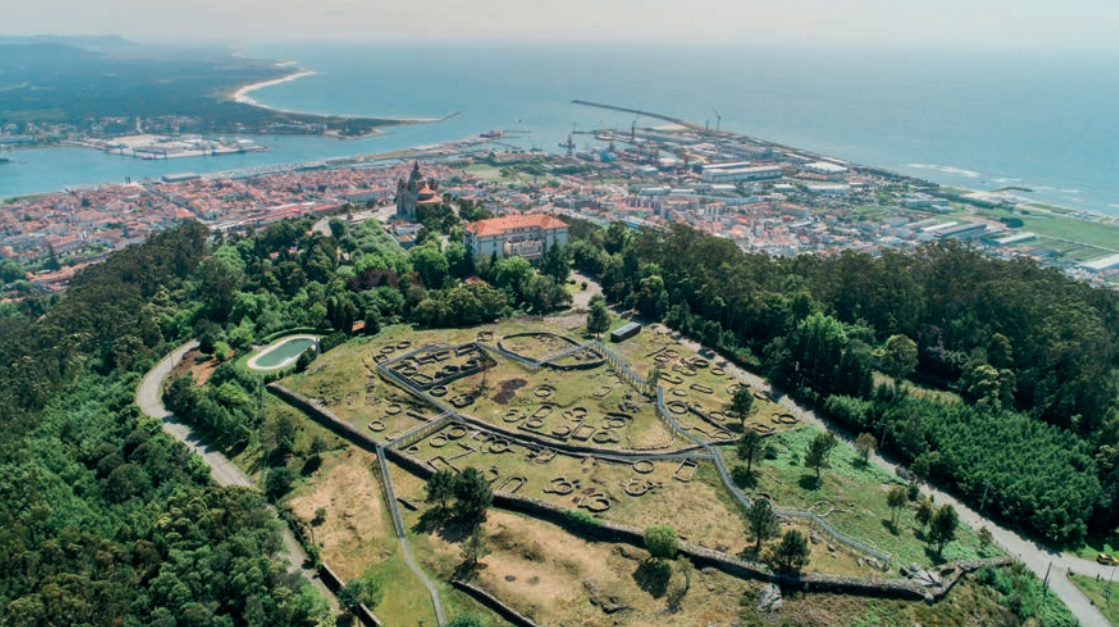
Citânia de Santa Luzia / Santa Luzia fortified oldvillage

O Aspirante Geoparque Viana do Castelo abrange toda a área do concelho, são cerca de 320 km 2 que acolhem a cidade atlântica mais a Norte de Portugal - Viana do Castelo. Um destino de excelência sustentado nas suas características geográficas de elevado valor ambiental, paisagístico, cultural e turístico, onde o património natural e cultural, material e imaterial, se encontram interligados, criando uma harmonia perfeita.