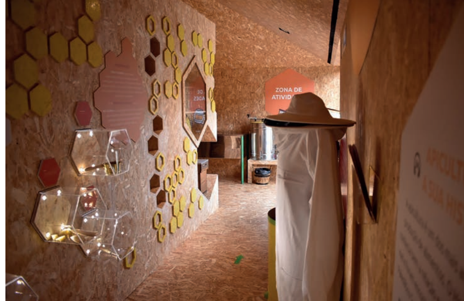
Porta do Neiva / Neiva Gateway